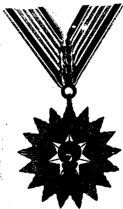
BINTANG KARTIKA.EKA PAKČI UTAMA